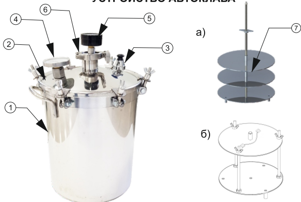
Рисунок 1. Общее устройство автоклава: а) 1-ый вариант кассеты для 0,5; 0,7 и 1 л банок; б) 2-ой вариант кассеты для 1,5; 2 и 3 л банок.

1. Бак с зажимами. 2. Крышка с уплотнителем. 3. Клапан сброса избыточного давления. 4. Термометр. 5. Манометр. 6. Кламповое соединение для надстройки (манометра). 7. Кассета: а) на 2 уровня банок 0,5 л и 1 уровень - 0,7; 1 л; б) для банок объемом: 1,5; 2 и 3 л.